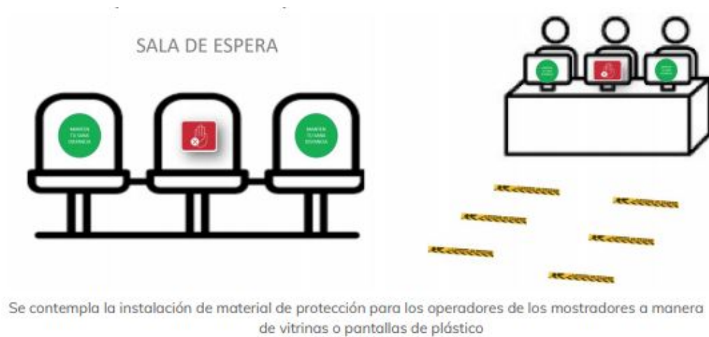
Se contempla la instalación de material de protección para los operadores de los mostradores a manera de vitrinas o pantallas de plástico