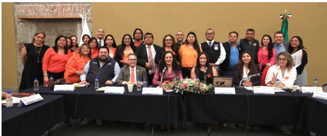
Imagen 14.- Tomada de la Comparecencia de la Titular de la Dirección General de Desarrollo Social, foto tomada el 25 de abril del 2022.