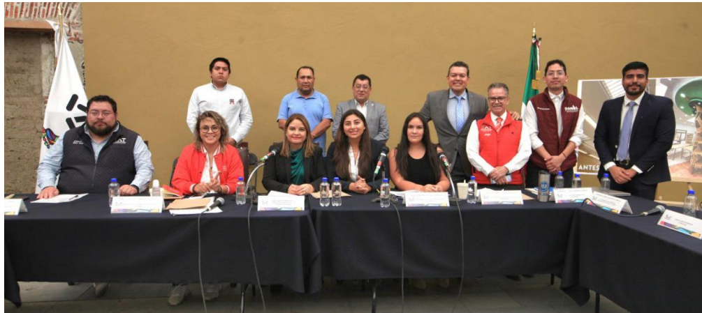
Imagen 13.- Tomada de la Comparecencia de la Titular de la Dirección General de Obras y Desarrollo Urbano, celebrada el 25 de abril del 2023. Archivo fotográfico de la Secretaría Técnica del Segundo Concejo de la Alcaldía de Tlalpan.