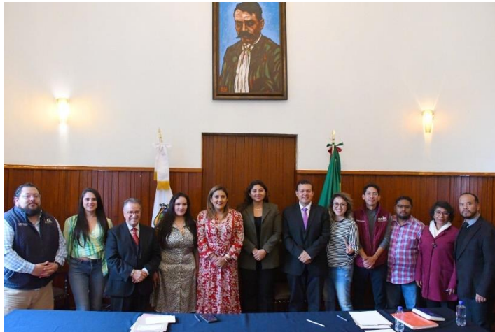
Imagen 1.- Vigésima Sesión Ordinaria del Concejo, foto tomada el 15 de agosto del 2023.

Desde su integración (01 de octubre 2021), el Segundo Concejo ha mantenido la misma estructura para, de esta manera, poder continuar garantizando el respeto al ejercicio de una representación ciudadana donde se asuman las responsabilidades y obligaciones correspondientes y bajo un ejercicio de transparencia y rendición de cuentas.