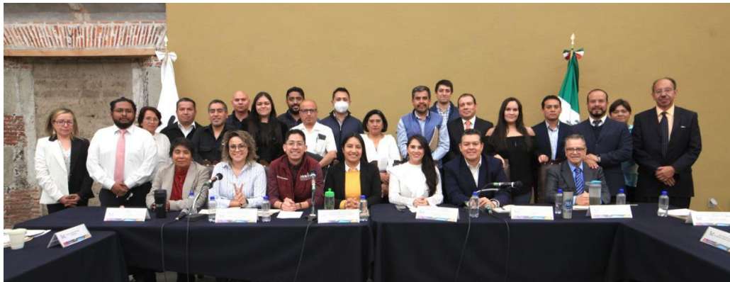
Imagen 19.- Tomada de la Comparecencia de la Titular de la Dirección General de Medio Ambiente, Desarrollo Sustentable y Fomento Económico, celebrada el 27 de abril del 2023.