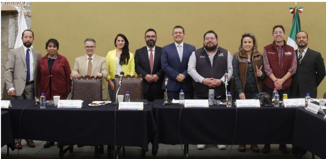
Imagen 16.- Tomada de la Comparecencia del Titular de la Dirección General de Participación Ciudadana, celebrada el 26 de abril del 2023.