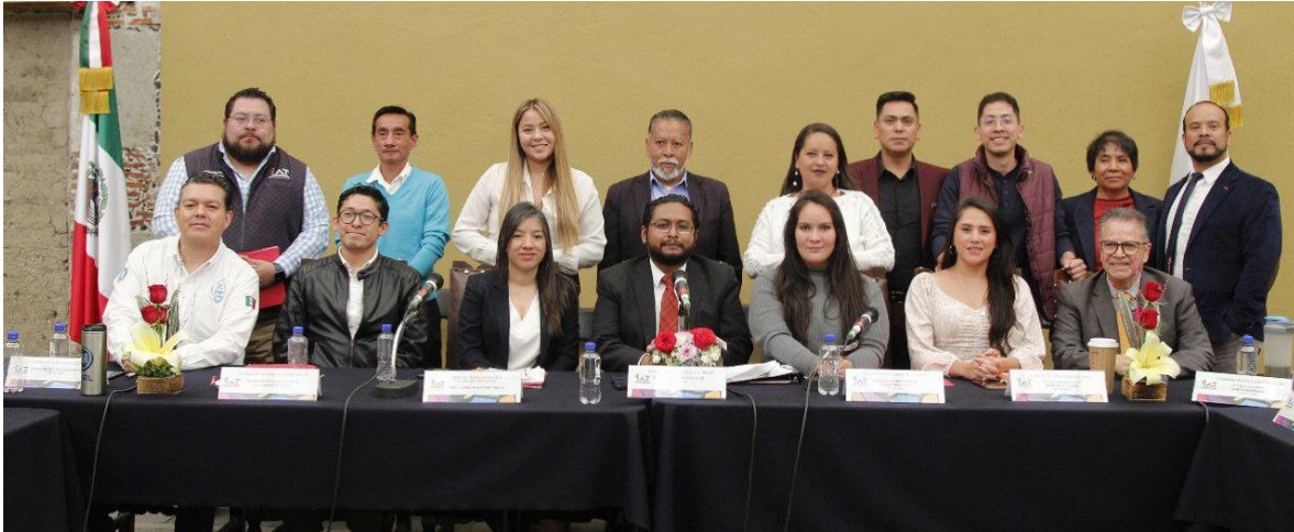
Imagen 21.- Tomada de la Comparecencia de la Titular de la Dirección General de Derechos Culturales y Educativos/Cultura, celebrada el 28 de abril del 2023.