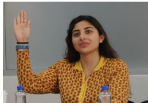
Imagen 9. Sesiones de Comisiones, fotos tomadas en el periodo del 01 de octubre del 2022 al 30 de septiembre de 2023.