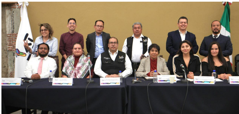
Imagen 20.- Tomada de la Comparecencia del Titular de la Dirección General de Asuntos Jurídicos y de Gobierno/Derechos Humanos, celebrada el 27 de abril del 2023.