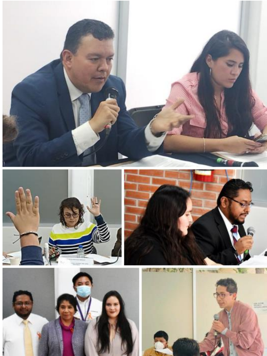
Imagen 10. Sesiones de Comisiones, fotos tomadas en el periodo del 01 de octubre del 2022 al 30 de septiembre de 2023.