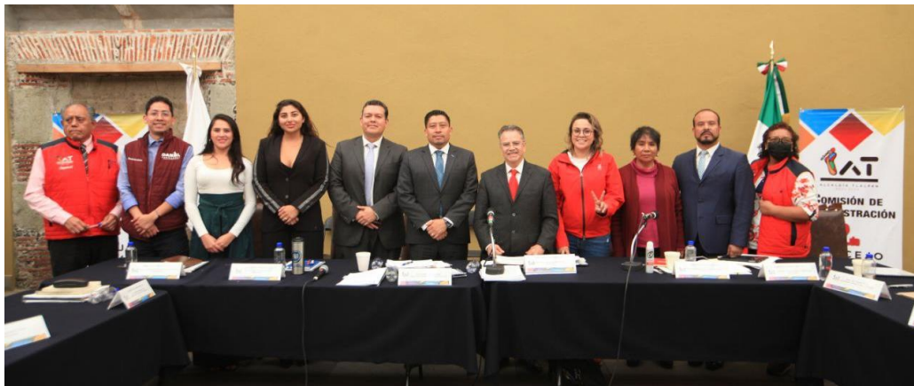
Imagen 11.- Tomada de la Comparecencia del Titular de la Dirección General de Administración, celebrada el 24 de abril del 2023.