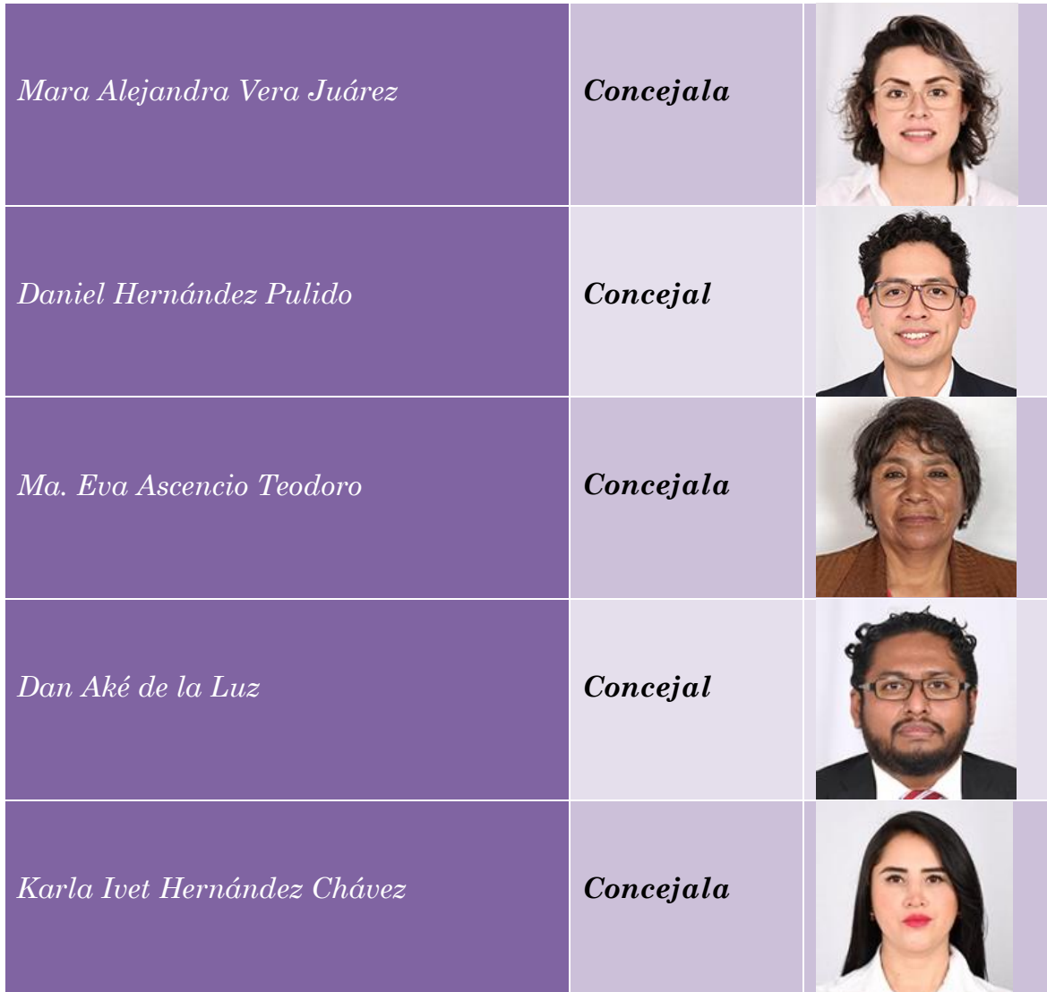
Imagen 2. Fotos oficiales de los integrantes del Concejo publicadas en el apartado del Directorio de la página oficial de la Alcaldía de Tlalpan. https://www.tlalpan.cdmx.gob.mx/concejo1/concejales/

El Concejo como Órgano Colegiado ha ejecutado sus funciones sustantivas de revisión, supervisión y evaluación de las acciones de gobierno emanadas del artículo 53, apartado C, numeral 3 de la Constitución Política de la Ciudad de México, así como del artículo 104 de la Ley Orgánica de Alcaldías de la Ciudad de México y el artículo 11 del Reglamento Interno del Concejo de Tlalpan.