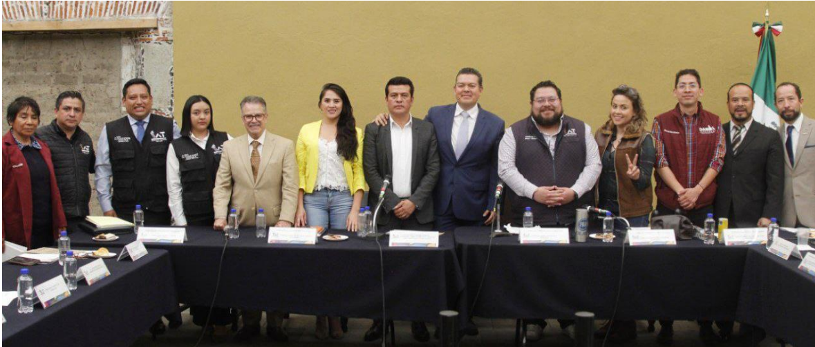
Imagen 17.- Tomada de la Comparecencia del Titular de la Dirección del Centro de Servicios y Atención Ciudadana/VUT, celebrada el 26 de abril del 2023.