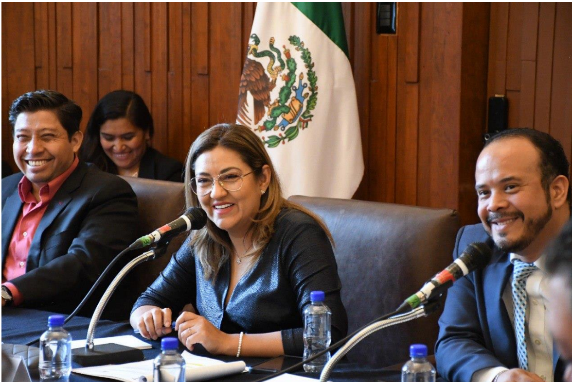
Imagen 7. Décima Quinta Sesión Ordinaria del Concejo, foto tomada el 30 de enero del 2023.

Durante el Primer Trimestre del 2023 (periodo del 1° de enero al 31 de marzo) se realizaron: 2 Sesiones Ordinarias .