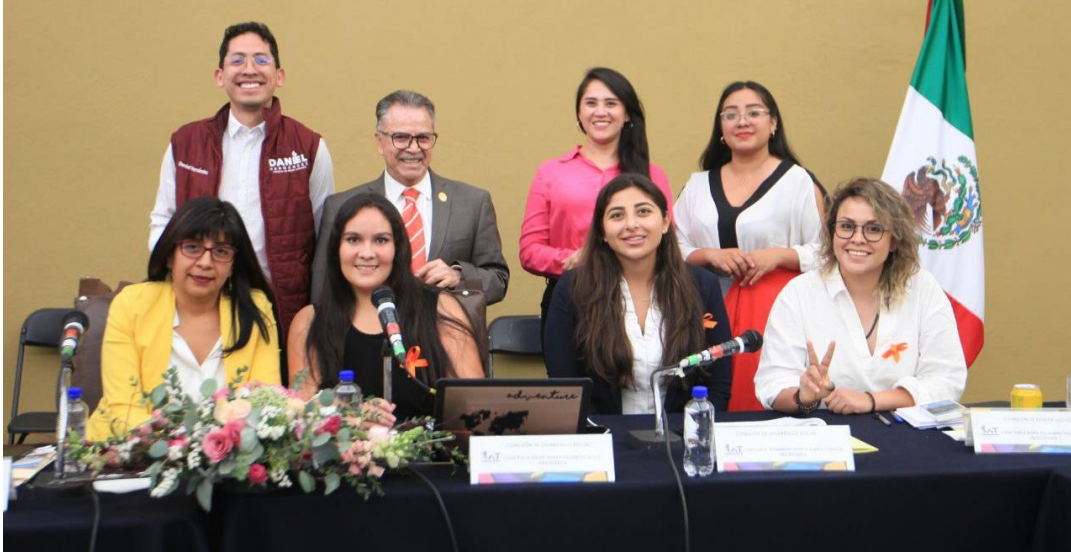
Imagen 15.- Tomada de la Comparecencia de la Titular de la Dirección de Comunicación Social, celebrada el 25 de abril del 2022.