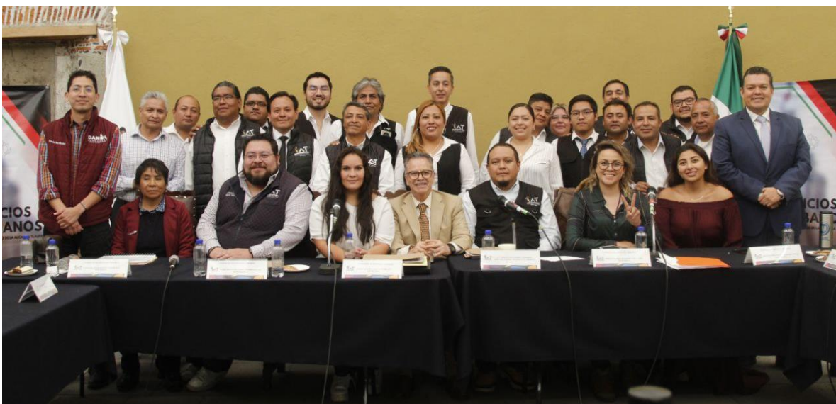
Imagen 18.- Tomada de la Comparecencia del Titular de la Dirección General de Servicios Urbanos, celebrada el 26 de abril del 2023. Archivo fotográfico de la Secretaría Técnica del Segundo Concejo de la Alcaldía de Tlalpan.