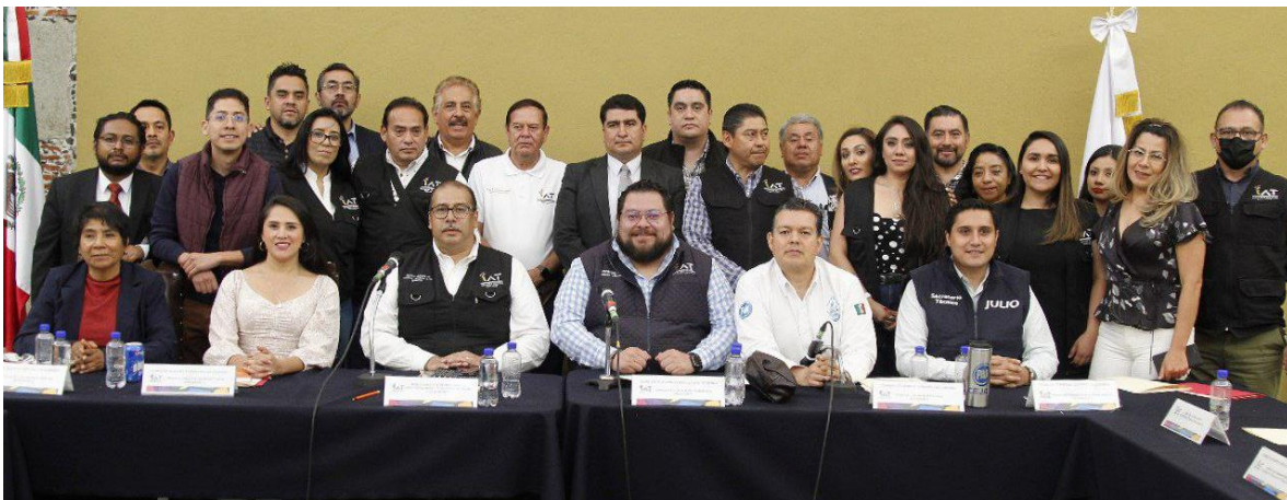
Imagen 22.- Tomada de la Comparecencia del Titular de la Dirección General de Asuntos Jurídicos y de Gobierno, celebrada el 28 de abril del 2023.