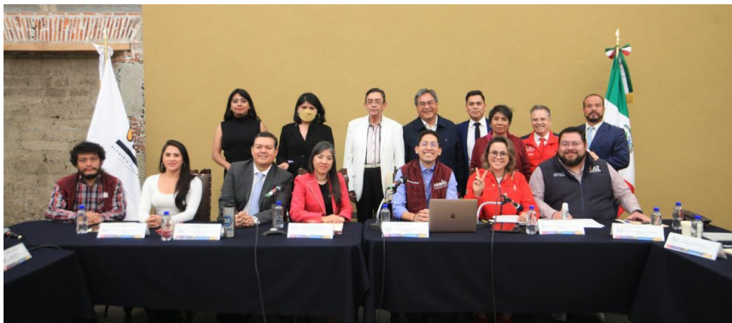
Imagen 12.- Tomada de la Comparecencia de la Titular de la Dirección General de Derechos Culturales y Educativos/Educación, celebrada el 24 de abril del 2023.