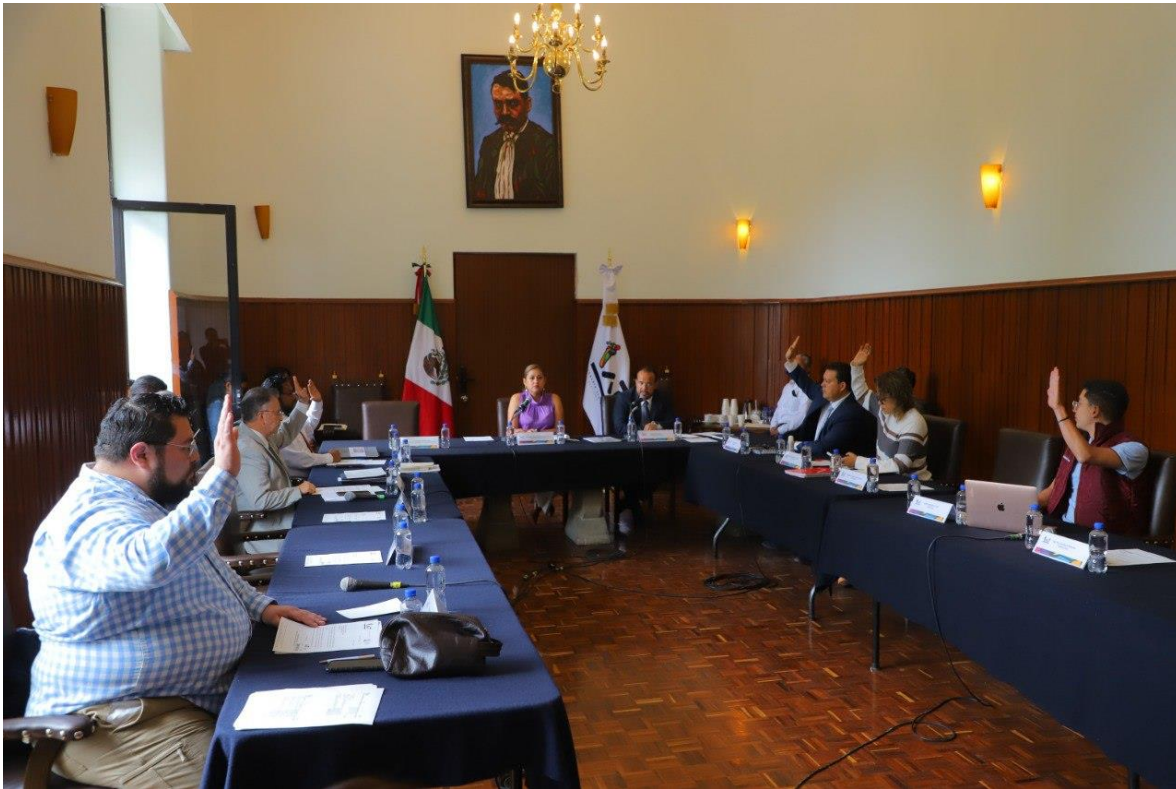
Imagen 8. Décima Séptima Sesión Ordinaria del Concejo, foto tomada el 10 de abril del 2023.

Durante el Segundo Trimestre del 2023 (periodo del 1° de abril al 30 de junio) se realizaron: 2 Sesiones Ordinarias .