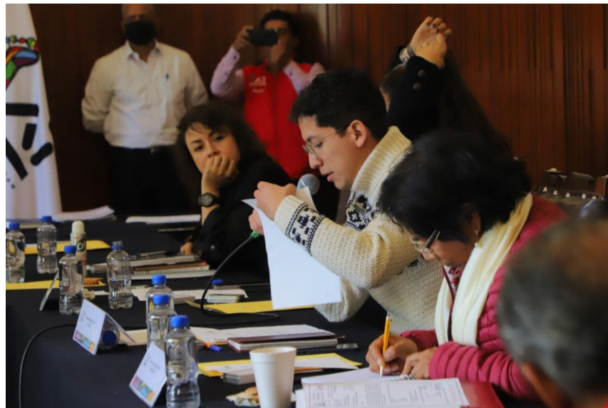
Imagen 5. Segunda Sesión Solemne del Concejo, foto tomada el 21 de diciembre de 2022.