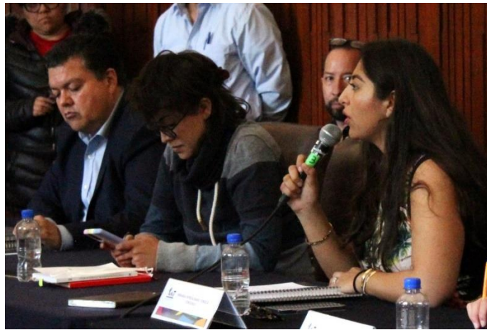
Imagen 6. Segunda Sesión Extraordinaria del Concejo, foto tomada el 17 de octubre de 2022.