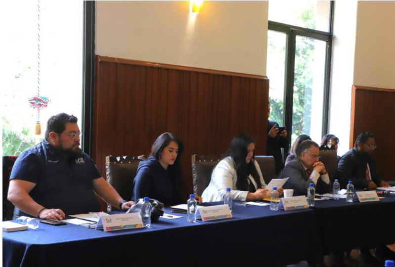
Imagen 4. Décima Cuarta Sesión Ordinaria del Concejo, foto tomada el 21 de diciembre de 2022.

En el Cuarto Trimestre del 2022 (periodo del 1° de octubre al 31 de diciembre) se realizaron: 1 Sesión Solemne, 2 extraordinarias y 2 Ordinarias.