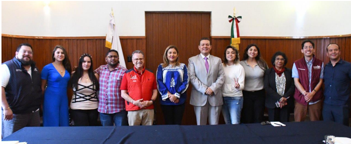
Imagen 24.- Vigésima Segunda Sesión Ordinaria del Concejo, foto tomada el 29 de septiembre de 2023.