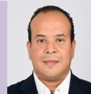
Imagen 3. Foto oficial del integrante del Concejo con funciones de Secretario Técnico, publicada en el apartado del Directorio de la página oficial de la Alcaldía de Tlalpan. https://www.tlalpan.cdmx.gob.mx/directorio-oficina/