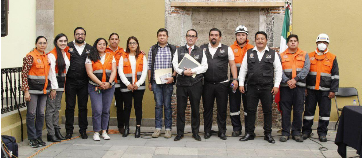
Imagen 23.- Tomada de la Comparecencia del Titular de la Dirección de Protección Civil, celebrada el 28 de abril del 2023.