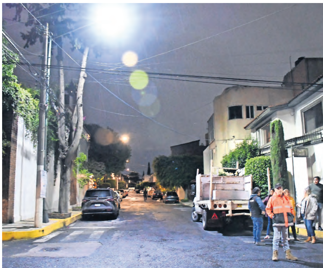
Calles iluminadas, más seguras y bonitas

Colonias, barrios y pueblos se han beneficiado del programa Alumbramos Tlalpan y continuaremos con nuestro propósito de tener una Alcaldía 100% iluminada para que mujeres, niñas, jóvenes o adultos mayores puedan seguir caminando de manera segura.