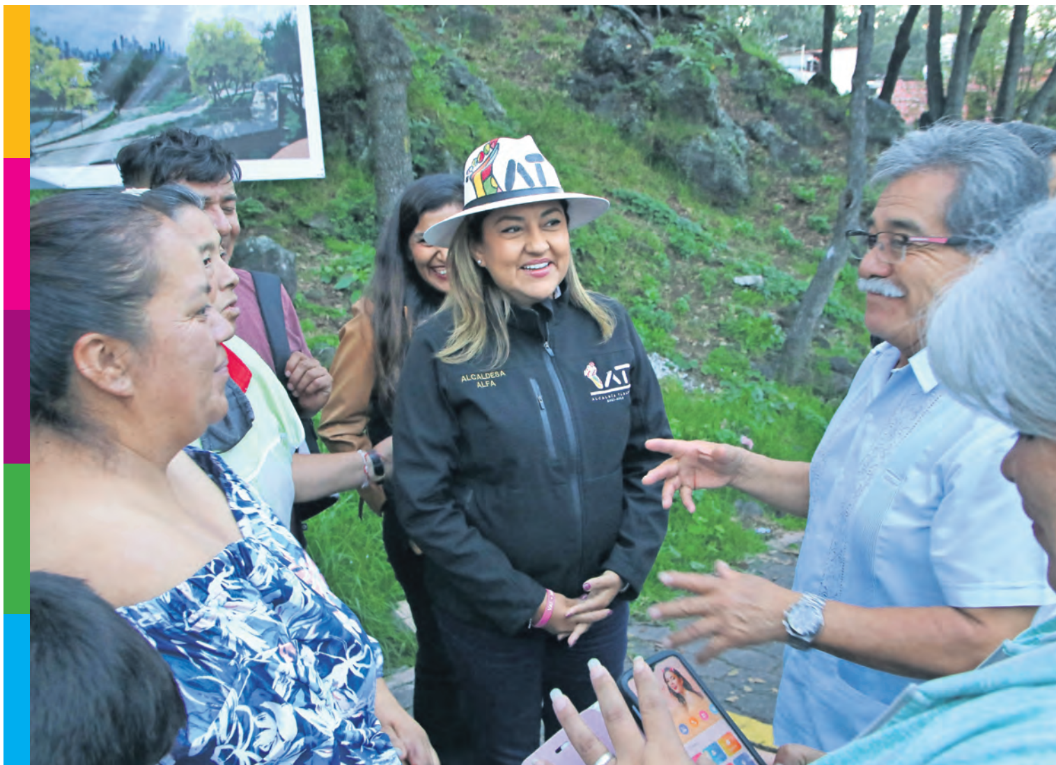
Con una inversión histórica de 15 millones de pesos, hacemos resurgir el Parque Morelos, en la colonia Miguel Hidalgo.